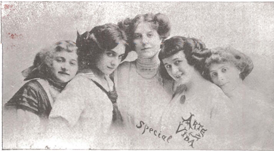
Grupo de señoritas yanquis que tomaron parte en el estreno de la comedia musical The Love Cure , de Henry W. Savage, en Nueva York

Princesas de los campos, gallardía lozana (¡oh, sonreír de los pastores!),