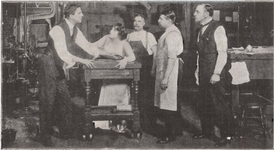
Señorita Paulina Frederick en el rol de Judit de The Fourth Estate , interponiéndose al Editor de The Advance para que no publique el artículo en que se expone la vergüenza de su padre, el Juez Bartelmy.