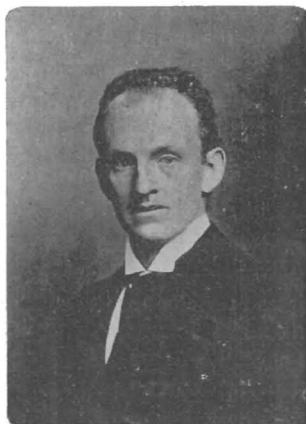
GERHART HAUPTMANN autor de „Almas Solitarias“

otros—no le debemos confundir, repito, con el teatro cerebral ó teatro de ideas que fracasó en París y que casi nunca tuvo éxito en Madrid. El teatro